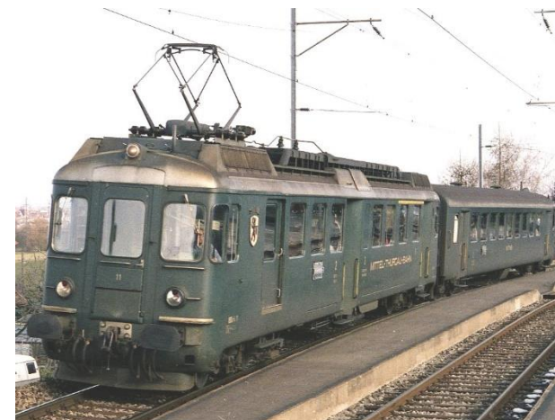
MThB Nr. 11 des VHMThB.

Die EAV Trieb- und Steuerwagen wurden unter Kreditbeihilfe des Bundes auf der Grundlage eines Gesetzes vom 20.12.1957 für 5 Nebenbahnen beschafft. Es war eine von der Industrie angepasste Version des RBe 4/4 der Schweizerischen Bundesbahnen mit etwa halber Leistung. Diese 5 Varianten unterscheiden sich zum Teil in der Inneneinrichtung und vor allem in der äusseren Farbgebung und Beschriftung. Die MThB und die MO Triebwagen waren zudem mit Ortswappen verziert.