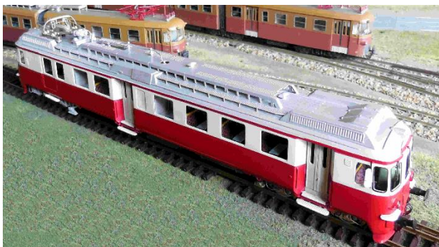
Gehäuse noch ohne Beschriftung, WM-Triebwagen