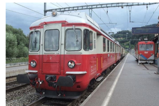
WM Nr. 2.