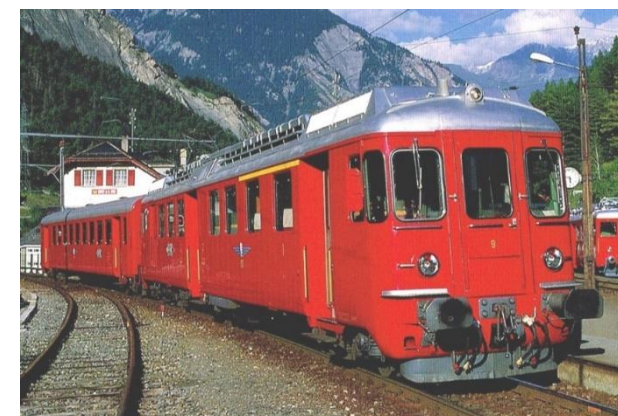
MO Nr. 9 bei TMR.